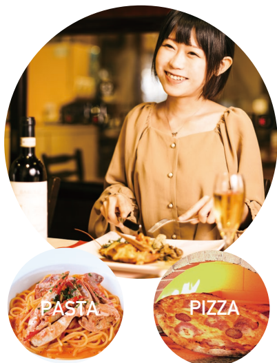
写真は5,500円コースの一例です