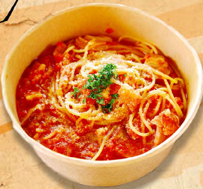
アマトリチャーナ