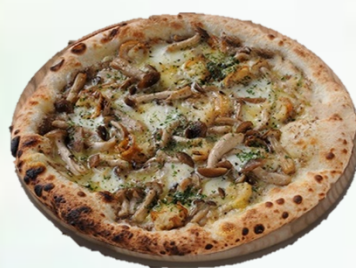
県産キノコのピッツァ