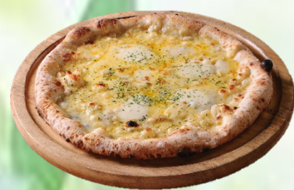
クアトロ・フォルマッジ