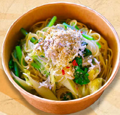
釜揚げしらすのペロンチーノ