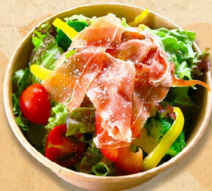
生ハムサラダ 900円 (税込)