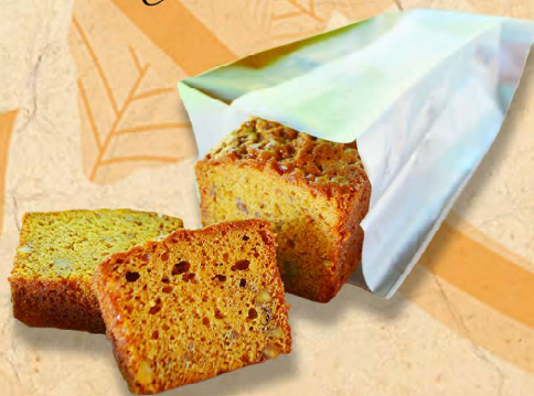
キャラメルナッツケーキ 850円 (税込)