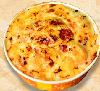
ぷりぷり海老ドリア