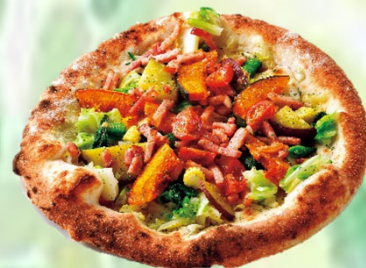
地場野菜と自家製燻製チーズ とベーコンのピッツァ