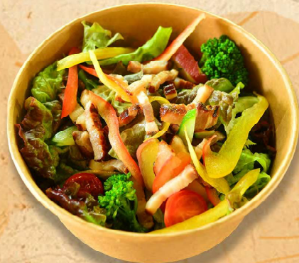
ベーコンサラダ 750円 (税込)