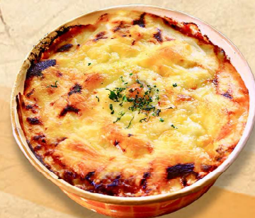
ボローニャ風ラザニア